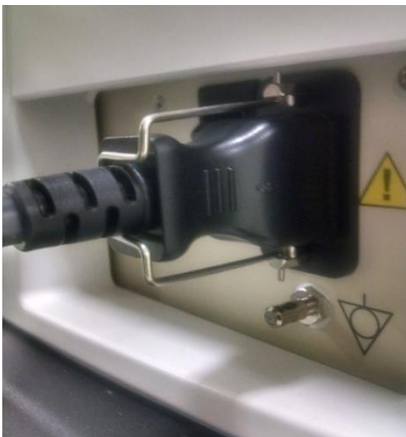
Barošanas vada novietojums iekārtas aizmugurē.

Ja iekārtas barošanas vada gals (skatiet attēlu tālāk) ir bojāts, pārtrauciet iekārtas lietošanu, līdz barošanas vads ir nomainīts. Ja iekārtai rodas barošanas padeves problēmas, pārtrauciet tās lietošanu un sazinieties ar GEHC Service.