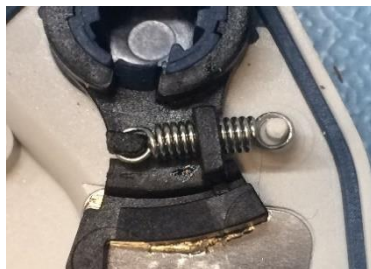
Vecā aizmugures plāksnīte