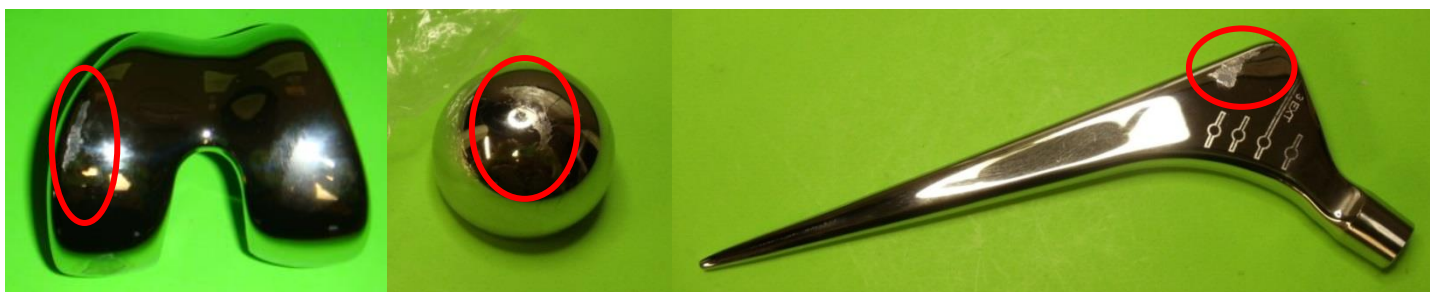
Figure 1: Knee Femoral Component, Hip Multipolar Shell and Hip CPT Stem with LDPE bag residue on implant

Affected Product: See Attachment 2 – Affected Product List